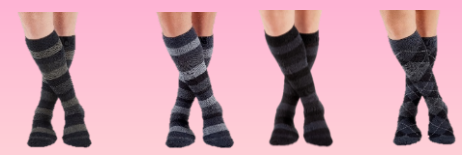
ダークネイビー・ストライプ グラファイト・ストライプ オニクス・ストライプ グラファイト・アーガイル