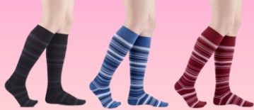
オニクス・ストライプ ジーンズ・ストライプ ワイン・ストライプ