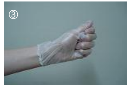
③ 中表に脱いだ手袋を片手に握る