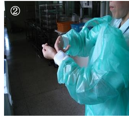
③ 片方の袖口の内側に指先を入れて腕を抜く