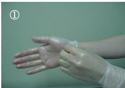
① 手首の部分をつまむ