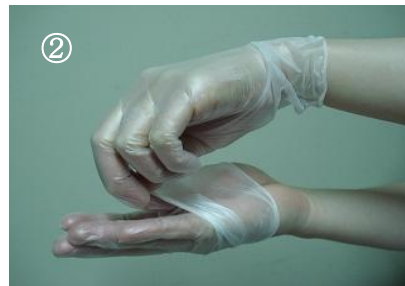
② 中表になるように脱ぐ