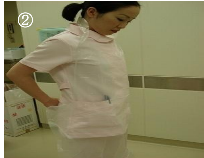
エプロンの前を開く