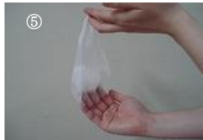
⑤ 中表になるように脱ぐ