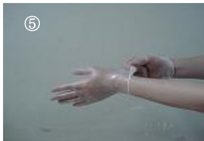
⑤ もう片方の手に着用する