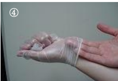
④ 手袋の表面に触れないように裾の内側に手を入れる