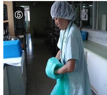
⑥ ガウンを中表にして小さく丸め、廃棄する