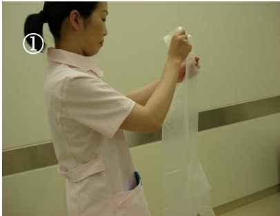
折り目が手前にくるように持ち 首の部分を開いてそっとかける