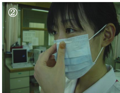
② ノーズピースを鼻の形に合わせる