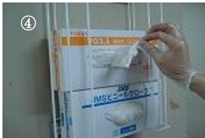
④ 手袋を着用した手でもう一枚取り出す