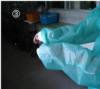
④ もう片方の袖口の部分を引っ張る