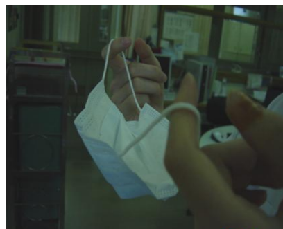
② 汚染面に触れないように外す