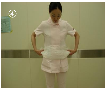
汚染面に触れないように下から内側 に折り返す