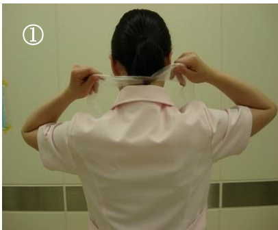
首の後ろの紐をちぎる