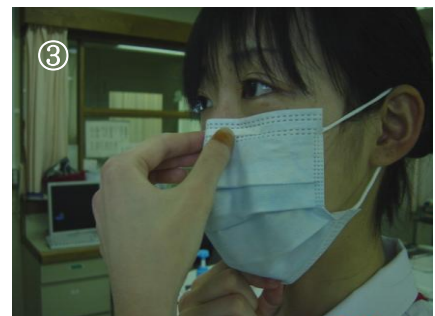
③ 顎の下までプリーツを伸ばす