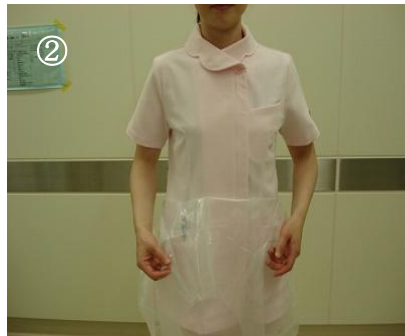
前あてを前に垂らす