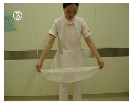
裾を手前に持ち上げる