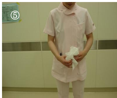
引っ張って腰ひもをちぎる