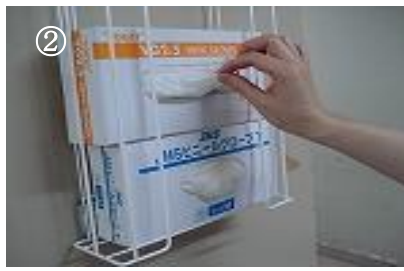
② 手袋の一部をつまみ引き出す