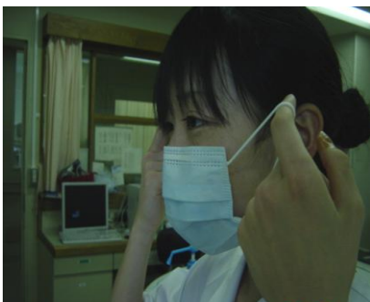
① マスクの表面に触れないように紐の部分を持つ