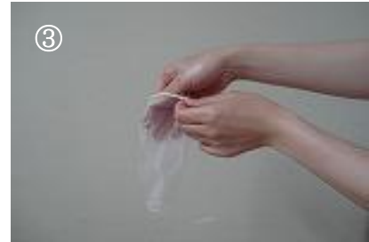
③ 片手に手袋を着用する