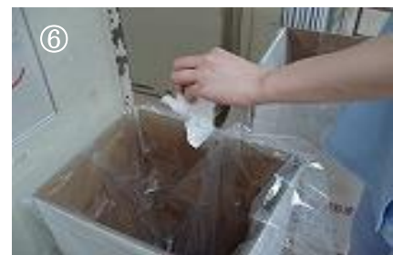
⑥ 廃棄し、手指衛生をする