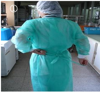
① 腰の紐、首の後ろのマジックテープを外す