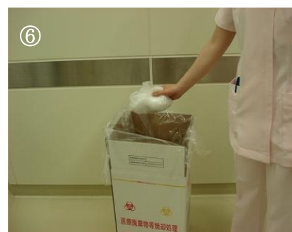
小さくまとめ廃棄する