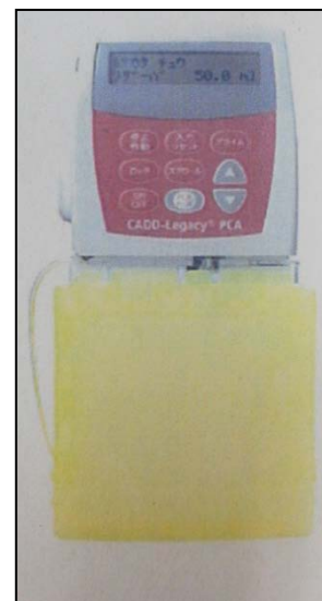
①PCA 装置 ②ポンプ部 ③フィルター付チューブ ④ポンプ部キャップ ⑤シリンジ ⑥薬液