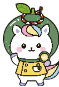
かんごちゃん 徳島県バージョン

manaable (マナブル) のご利用には、利用者登録が必要です。 利用者登録は、お済みでしょうか？