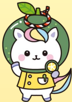
徳島県すだちバージョン かんごちゃん