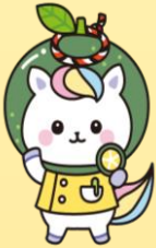
徳島県すだち バージョン かんごちゃん